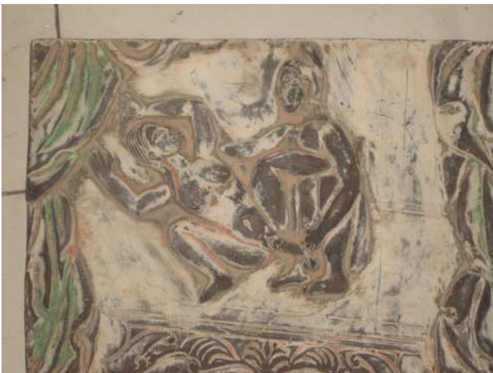
从汉画像砖中可以看出中国古代对性欲表达的不禁止态度

http://blog.sina.com.cn/s/blog_40206c2f01000677.html